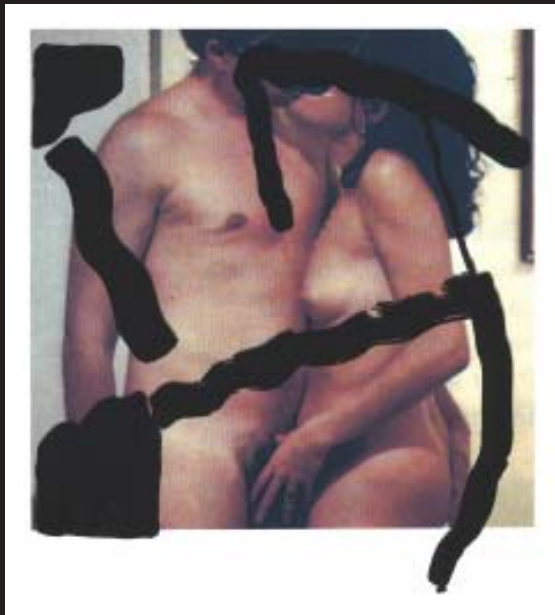
Il·lustracions de JOSÉ NORIEGA

LA GARÚA Libros i la Llibreria Carrer Major es complauen a convidar-vos a la presentació del llibre